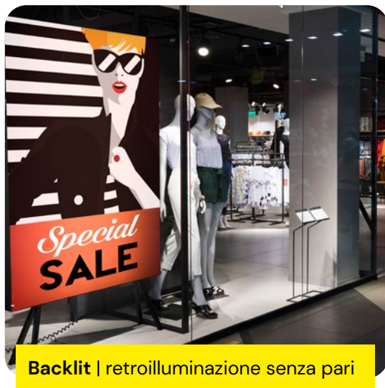
Backlit | retroilluminazione senza pari