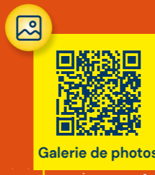
Galerie de photos