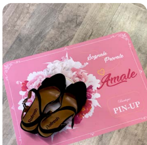
Tack Puro | calpestabile riposizionabile